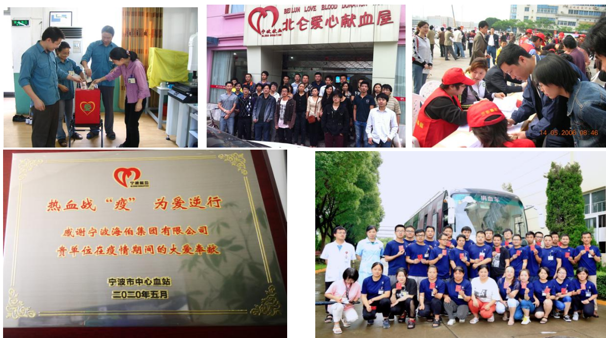
图 海伯开展慈善捐赠和献血活动

2021.11.11 海伯集团为芙蓉社区捐赠防疫物资，一次性口罩 5000 个，防护衣 8 件，普通口罩 488 个，防护服 8 件。