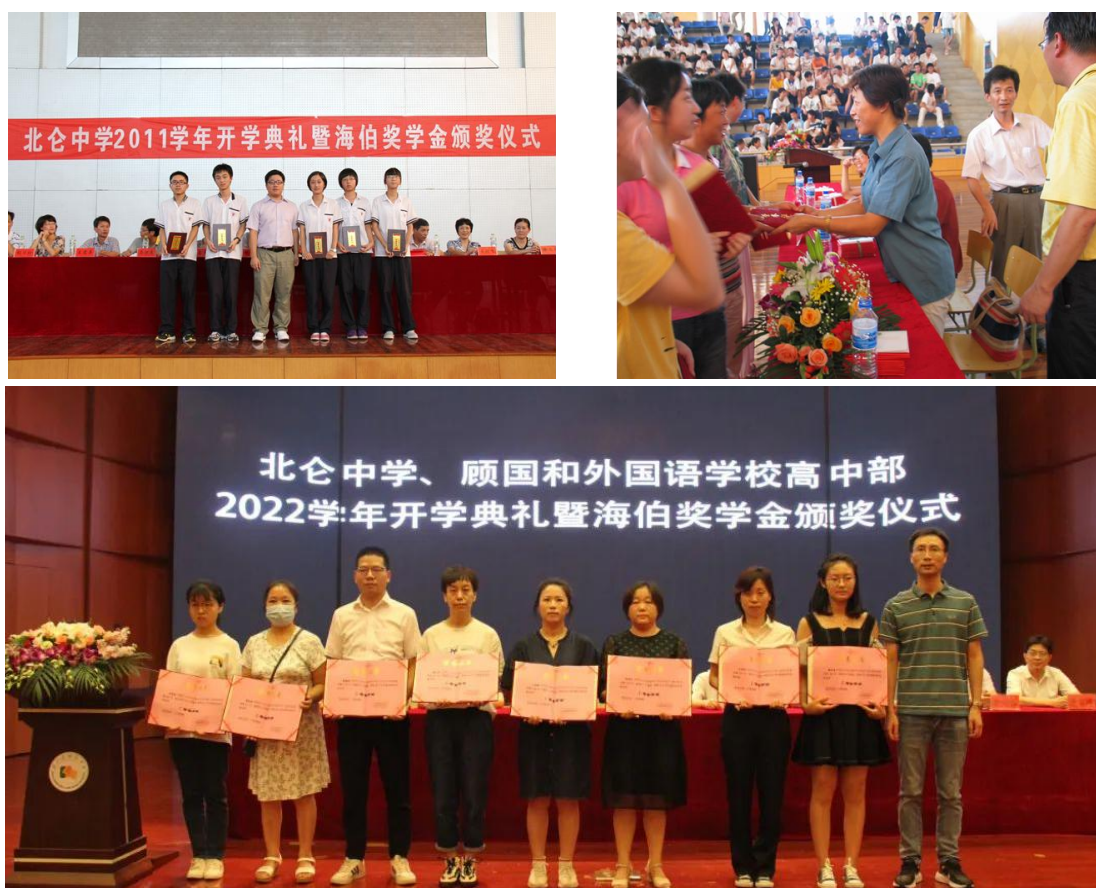
图 4 海伯支持教育事业

2018 年，公司为北仑职业高级中学“珍珠”慈善基金捐赠 3 万元，资助北仑职高学子完成学业，鼓励学生自主创业。公司为中国文教体育用品协会捐助贫困助学金 1 万元。此外，海伯在阳光学校（智障儿童学校）设置安装海伯产品智能控制系统，防止学生走失。与多所学校贫困学生开展接对助学活动。