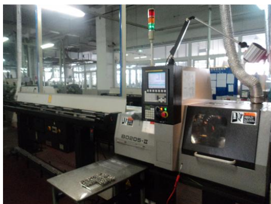
津上精密数控机床