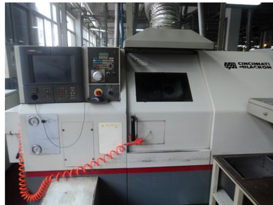
辛辛那提数控车床