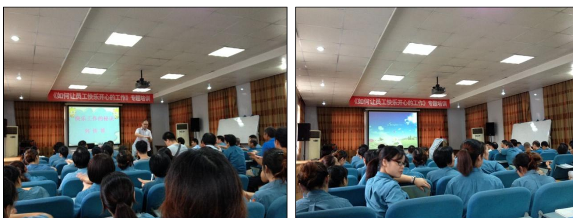
图 4.4- 1 “如何让员工快乐工作”培训现场

推行快乐工作：为改变员工工作态度，提高工作积极性，把工作与生活紧密相连，使员工能在工作中得到更多的快乐，公司开展“让员工快乐工作”课程培训。